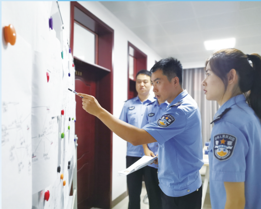
专案组民警正在分析研判案情

度假区警方提醒,网络赌博危害极大,不少“赌客”短时间内就倾家荡产,甚至家破人亡;买卖、租借银行卡均属违法行为,绝大部分电信网络诈骗都借助银行卡实现转账套现,为了蝇头小利,买卖、租借自己的银行卡,极有可能被收购者用来从事违法犯罪活动,轻则影响本人征信,重则有很大法律风险,甚至要承担刑事责任,切勿一时贪便宜,给个人和家庭造成极大的经济损失和伤害。