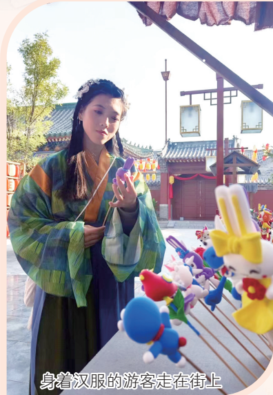
身着汉服的游客走在街上