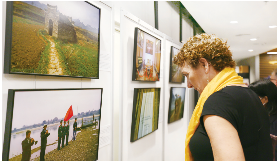
10月24日，参观者在以色列特拉维夫举办的以色列退伍老兵武大伟“重走长征路”摄影展上欣赏图片。

武大伟出生于1935年，自年少起便对遥远而神秘的东方大国充满好奇。在熟读美国记者埃德加·斯诺的《红星照耀中国》，并偶然看到了有关长征的影像资料后，这位长大后成为一名伞兵指挥官的以