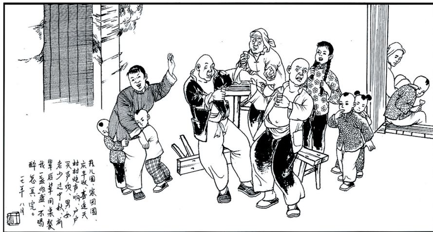
20世纪聊城民间过中秋节的场景。王发社 作

聊城中秋节的饮食风俗主要是吃月饼，除此之外，聊城人往往会在中秋节晚上举行家宴，全家人坐在院内一边赏月一边吃月饼、苹果、板栗、石榴等。这在鲁西