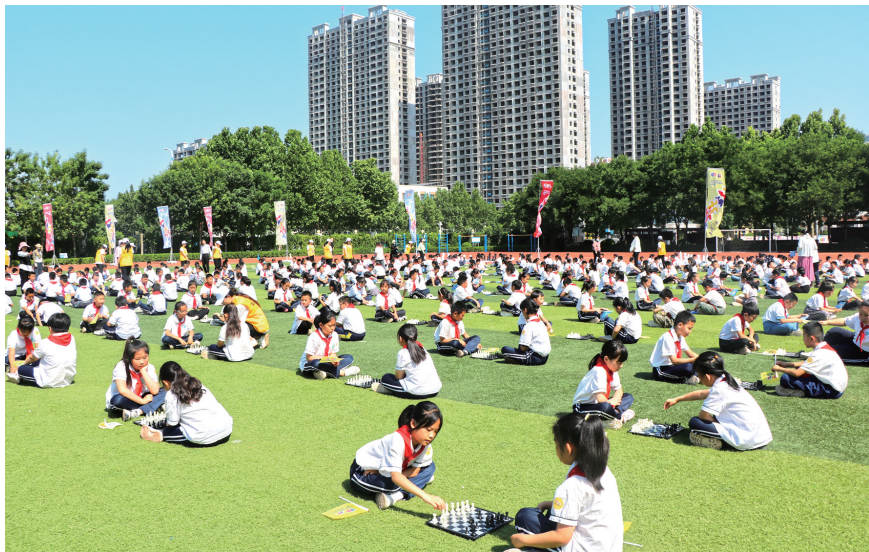
参赛小选手在比赛中

本报讯(文/图 通讯员 李小芹 王杰)6月1日,2023年“奔跑吧·少年”全国儿童青少年国际象棋系列活动启动仪式在聊城市实验小学举行。