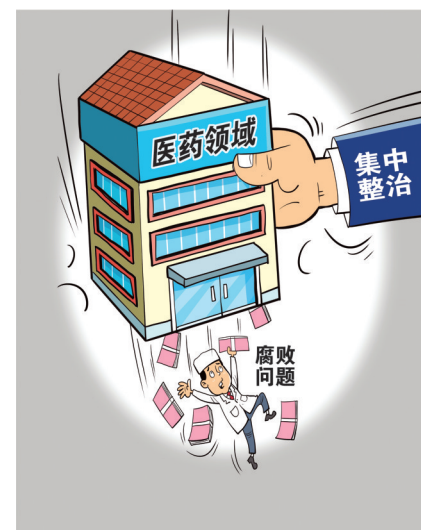
集中整治 新华社发 朱慧卿 作