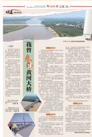
《聊城晚报》刊发的庞洪锋稿件(资料图)