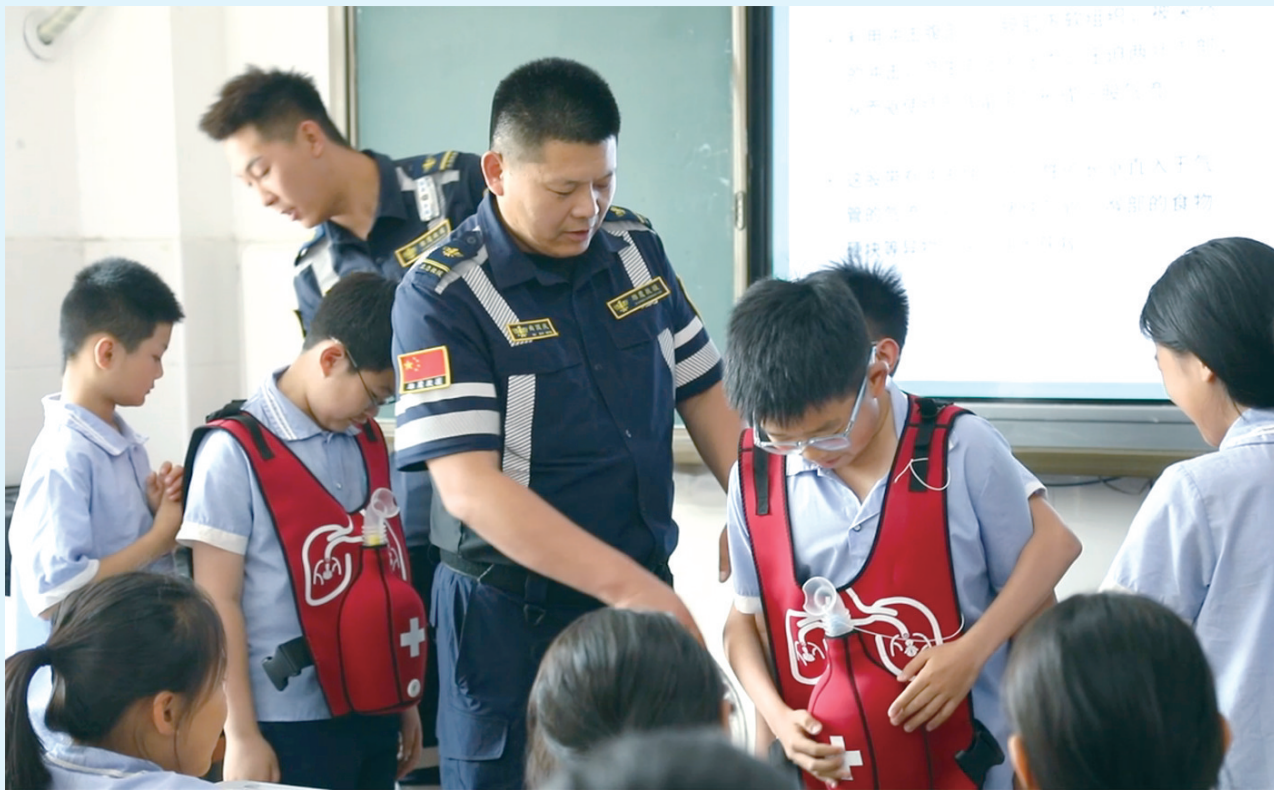
6月23日,聊城市东昌府区雄鹰救援志愿者协会志愿者走进阳光小学,开展暑期防溺水安全教育。他们通过案例讲解、互动问答和救生器材实操演示,向学生普及防溺水知识,帮助学生掌握应急自救技能。