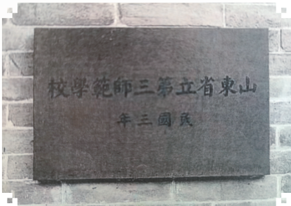
山东省立第三师范学校铭牌