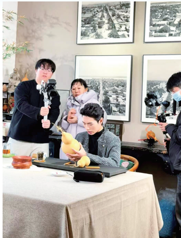
剧组在古城葫芦创意工坊内拍摄

据悉,聊城大学与市文旅集团已达成合作意向,未来将围绕运河文化、红色资源开发系列IP。孙建德表示:“《葫映奇缘》是一个起点,我们期待持续以年轻人喜爱的方式,创新讲述聊城故事,让聊城文化不仅‘出圈’,更能持久‘出彩’。”