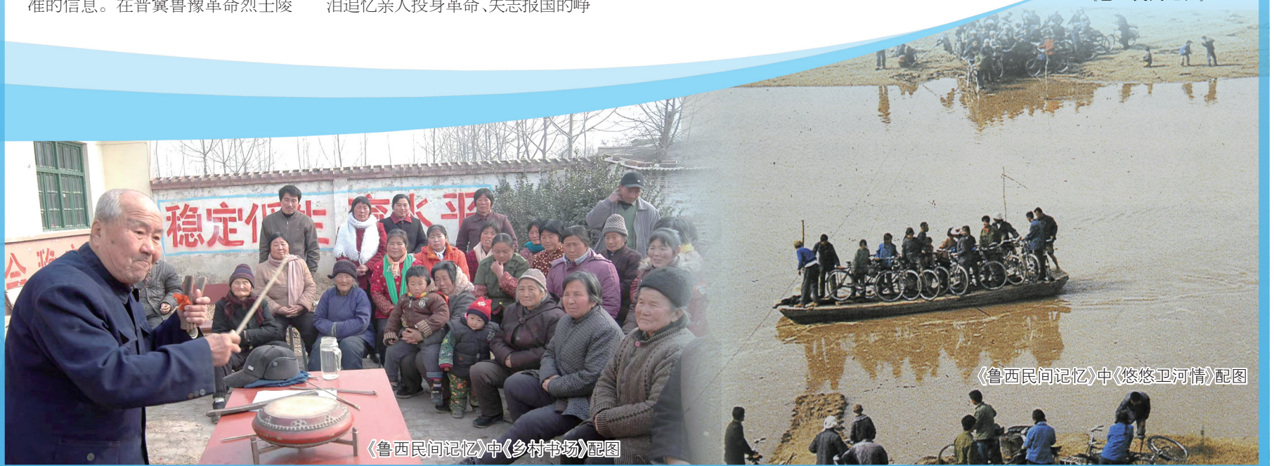
《鲁西民间记忆》中《乡村市场》配图