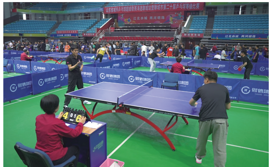
4月26日，山东省城市乒乓球超级联赛聊城站海选比赛与聊城市第二十届乒乓球等级赛在聊城体育馆同步举办。图为比赛现场。