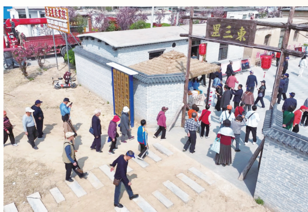
东三里庄村游人如织

本报讯(文/图 记者 刘亚杰 通讯员 张清强 张占晓)4月25日,以鲁西抗战历史为原型的红色主旋律电影《鲁西儿女》正式上映。影片核心取景地冠县清泉街道东三里庄村,迎来了属于它的“高光时刻”。