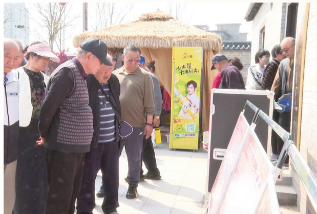
市民游客在阅读历史资料