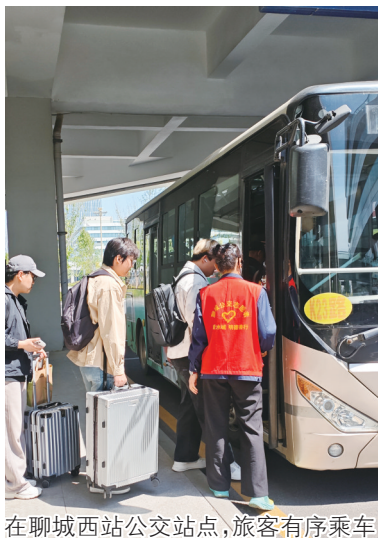
在聊城西站公交站点,旅客有序乘车

本报讯(文/图 记者 张承斌 通讯员 王之荣)“五一”假期,我市探亲、旅游等出行需求集中释放,交通运输客流大幅增长。交通运输部门提前部署、科学调配、从严监管,道路、铁路、城市公交协同发力,实现运输秩序平稳、服务保障到位。假期期间,全市未发生交通运输安全生产事故,圆满完成假期旅客运输保障任务。