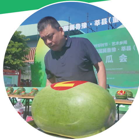
赛瓜会现场,工作人员在称重

地处冀鲁豫三省交界的莘县董杜庄镇,瓜菜种植已有30余年历史,全镇瓜菜种植面积4万亩(1亩合666.67平方米)、年交易量60万吨,农民人均年纯收入突破4万元。作为鲁西最大的早春大拱棚西瓜生产基地,通过此次瓜文化节,董杜庄镇以瓜为媒、以节会友,全方位展示现代农业发展的“甜蜜成果”,为八方来客呈现了一场别开生面的乡村振兴盛宴。