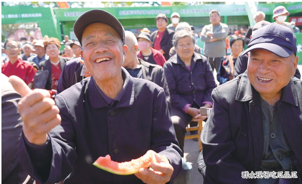
群众现场吃瓜品瓜