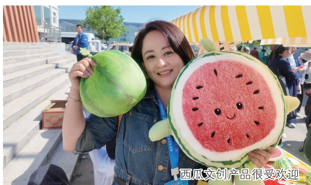
西瓜文创产品很受欢迎