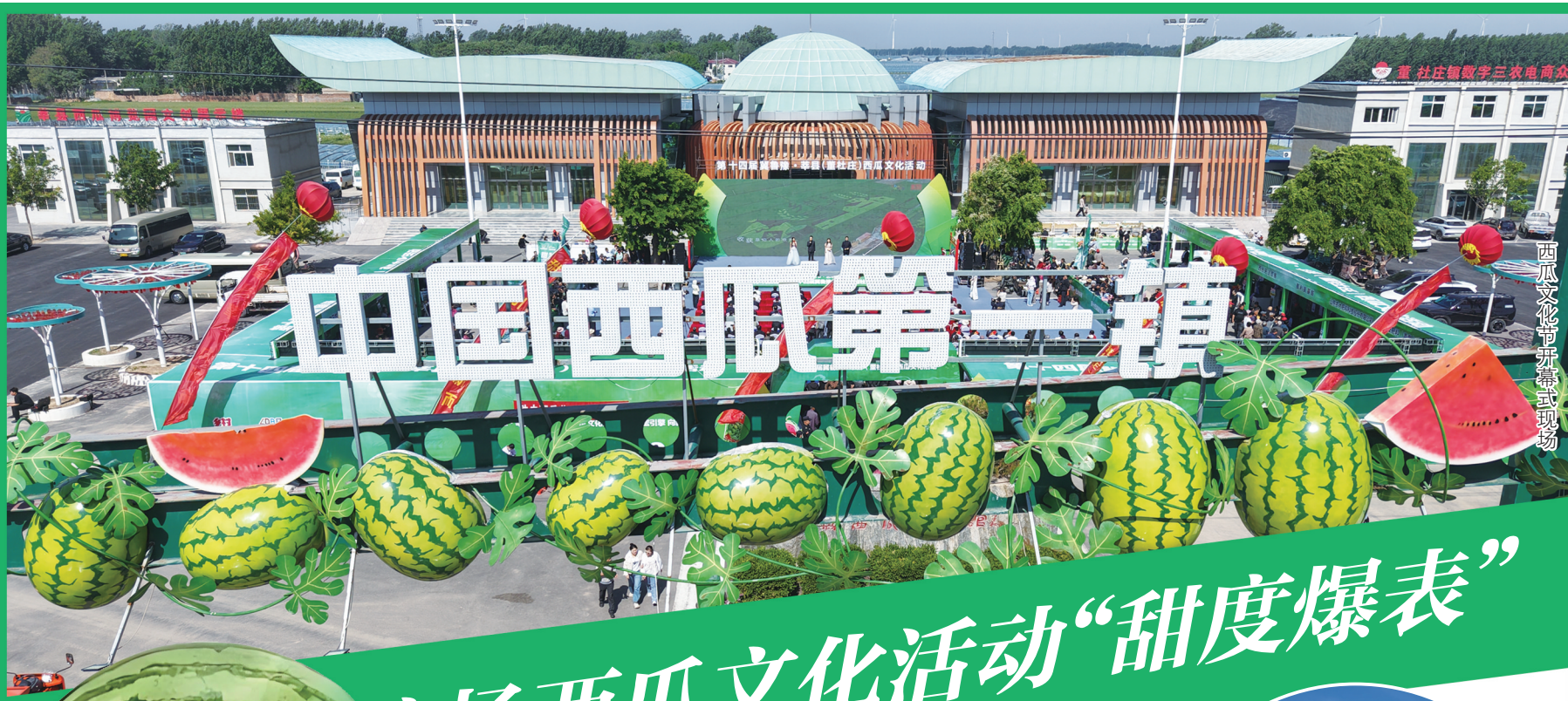
西瓜文化节开幕式现场