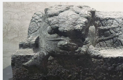
阳谷县张秋镇出土的衔鱼镇水兽

千年以降,运河不息。它在历史中沉淀“和谐、爱国”的深厚基因,在流动中激荡“自由、平等”的开放气度,在传承中彰显“诚信、友善”的文明温度,在新时代继续奔腾向前,凝聚起一个民族走向复兴的深沉力量。