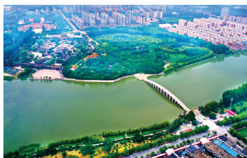
洛神湖国家湿地公园