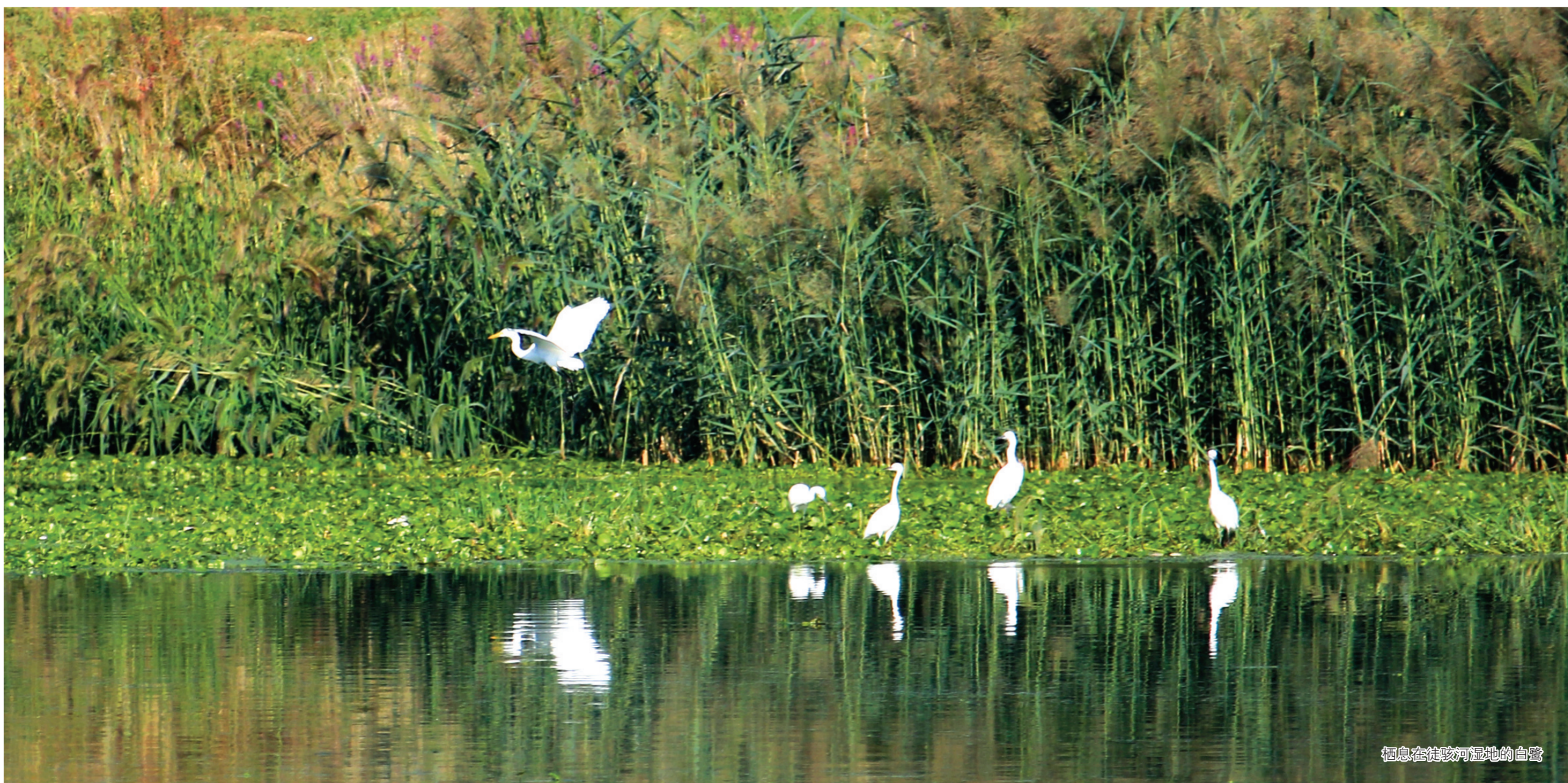
栖息在徒骇河湿地的白鹭