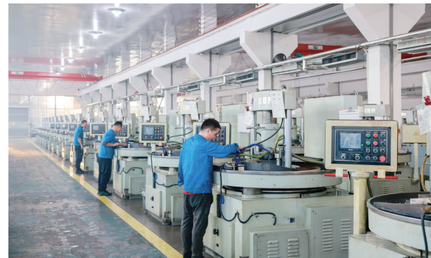
3月28日,在东阿钢铁集团有限公司的生产车间里,机器运转的轰鸣声此起彼伏,一派繁忙景象。东阿钢铁集团有限公司年产钢球400亿粒、圆锥滚子3亿粒、轴承钢球4.5万吨。公司年销售收入12.1亿元,利税1.1亿元。

此外,我市全力打造一对“投资项目会客厅”模式,同步在聊城市政务服务网工程建设项目审批大厅推出“线上会客厅”,设计48道选择题,配备智能引导,根据项目单位填报情况系统自动生成“量身定做”的审批流程,配套生成“办理流程图”,实现项目单位一键自主申报。同时,开通EMS免费邮寄,办理事项申报过程中需要审核的原件以及办理结束后的证照批文可通过EMS免费邮寄,切实提升了企业群众办事体验。