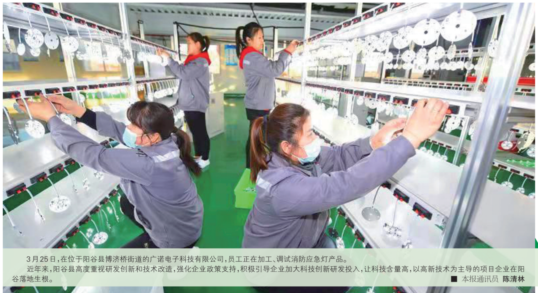
3月25日,在位于阳谷县博济桥街道的广诺电子科技有限公司,员工正在加工、调试消防应急灯产品。近年来,阳谷县高度重视研发创新和技术改造,强化企业政策支持,积极引导企业加大科技创新研发投入,让科技含量高,以高新技术为主导的项目企业在阳谷落地生根。 本报通讯员 陈清林

“1”即“一个制度”。临清市建立市场主体注销研判制度,组织富有经验的市场监管领域审批人员、法律顾问等深入研究“代位注销”出清,明确代位注销适用情形、程序等;积极加强同法院的沟通联系,充分发挥登记机关与人民法院各自职能作用推行“府院联动”和强制出清,在保障债权人等相关方利益的同时,及时清理消灭“失联企业”“僵尸企业”,促进市场主体新陈代谢与良性循环。