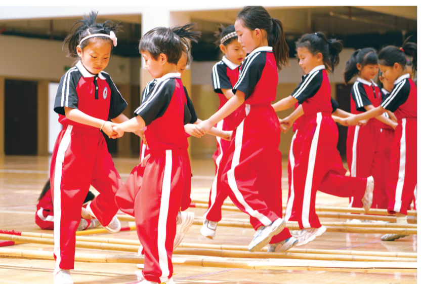
5月19日,高唐县第一实验小学一年级6班的学生正在跳“竹竿舞”。