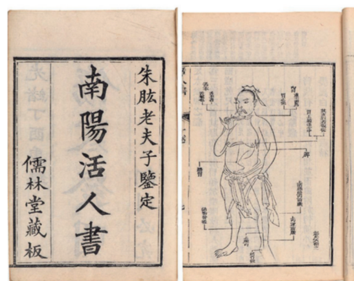
《南阳活人书》朱肱著 清光绪二十三年(1897年)刻本