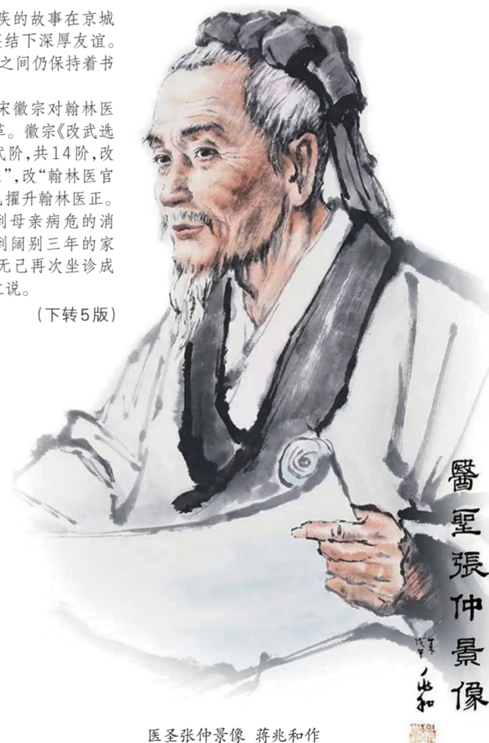
医圣张仲景像 蒋兆和作