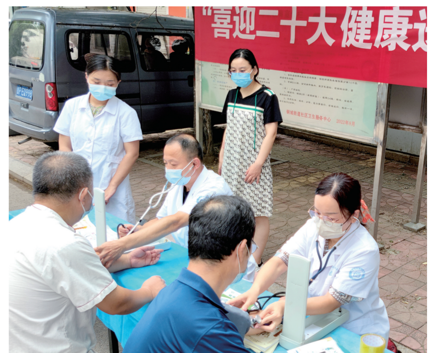
8月19日,东阿县铜城街道社区卫生服务中心组织义诊服务队携带诊疗器械和药品,来到铜城街道光明街,开展“喜迎二十大 健康送万家”义诊活动。该中心内科、中医科、理疗科主要骨干医护人员参加了此次义诊活动。本次义诊活动共服务群众118人次,发放各种宣传资料300余份。

经历了两个小时的紧张奋战,手术圆满结束。郭朝普走出手术室,他的手术服已经湿透,身体虽然疲惫,但他的心里,满是欣慰。