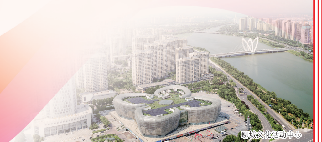
聊城文化活动中心

梦想照亮前方，奋进正当其时。东昌府区深入学习贯彻党的二十大精神，以习近平新时代中国特色社会主义思想为指导，坚定拥护“两个确立”，坚决做到“两个维护”，锚定“走在前、开新局”，聚焦“六个新聊城”建设，努力在经济社会高质量发展上取得新的更大成效，书写加快建设社会主义现代化强区的壮丽篇章！