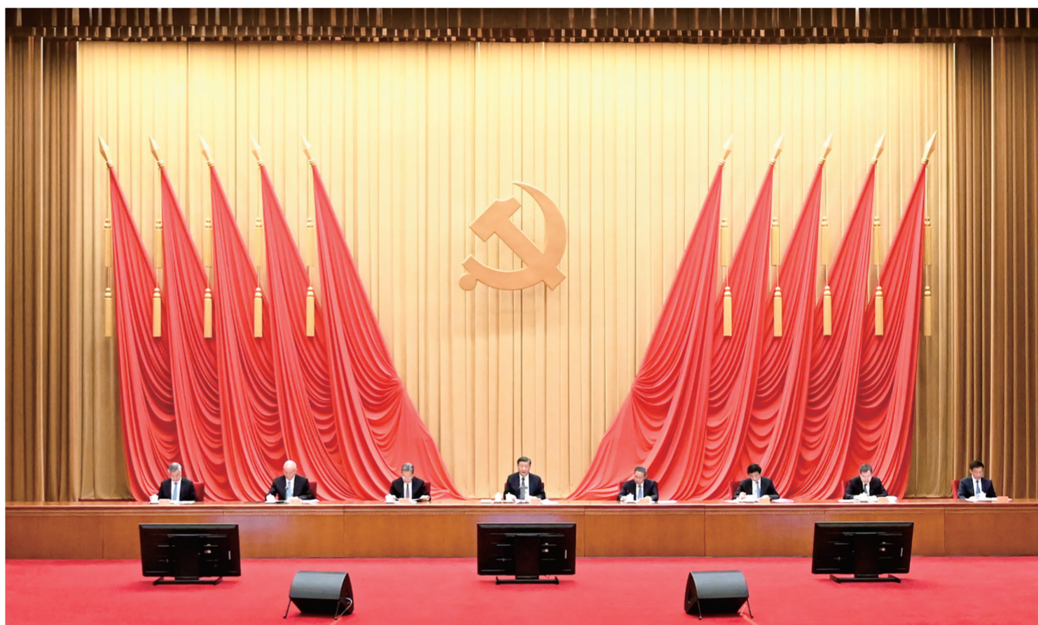
4月3日，学习贯彻习近平新时代中国特色社会主义思想主题教育工作会议在北京召开。中共中央总书记、国家主席、中央军委主席习近平出席会议并发表重要讲话。