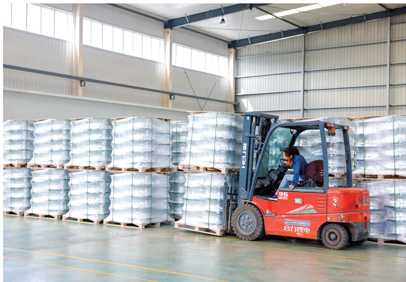
5月9日,在山东骏程金属科技有限公司生产车间,工人在装卸车轮产品。 山东骏程金属科技有限公司与山东大学材料学院开展合作,通过改变合金晶粒尺寸,提高产品性能,企业生产的22.5英寸铝合金轮毂成为国内通过认证的最轻轮毂。在创新发展中,我市各级在搭建平台、优化服务上下功夫,为企业对接科研院所、开展成果转化牵线搭桥。 ■ 本报记者 商景豪

事,开展分众化、对象化、互动化宣讲活动。庭院课堂、田间课堂、广场课堂、车间课堂……他们把讲台搬到群众身边,把“大道理”与妇女群众的“小日子”结合起来,实现理论与群众“面对面”“零距离”,推动党的创新理论“飞入寻常百姓家”,切实提高宣讲的参与度和吸引力。 “我们以品牌为抓手,构建妇联系统大宣讲格局,立足线上线下两个阵地,聚焦‘线上’有知有味,赋能‘线下’出新出彩,让‘小团队’迸发‘大能量’,借‘小平台’盘活‘大链条’,用‘小服务’托起‘大幸福’,努力推动巾帼宣讲‘声’入人心。”在茌平区妇联党组书记、主席靖志敏说。