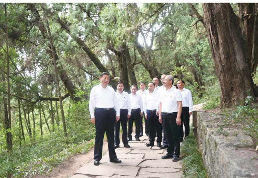
7月25日至27日，中共中央总书记、国家主席、中央军委主席习近平在四川考察。这是25日下午，习近平在广元市剑阁县翠云廊考察。

段，有迄今保存最完整的古代人工栽植驿道古柏群。习近平听取古蜀道发展历程、翠云廊整体情况介绍，沿古道步