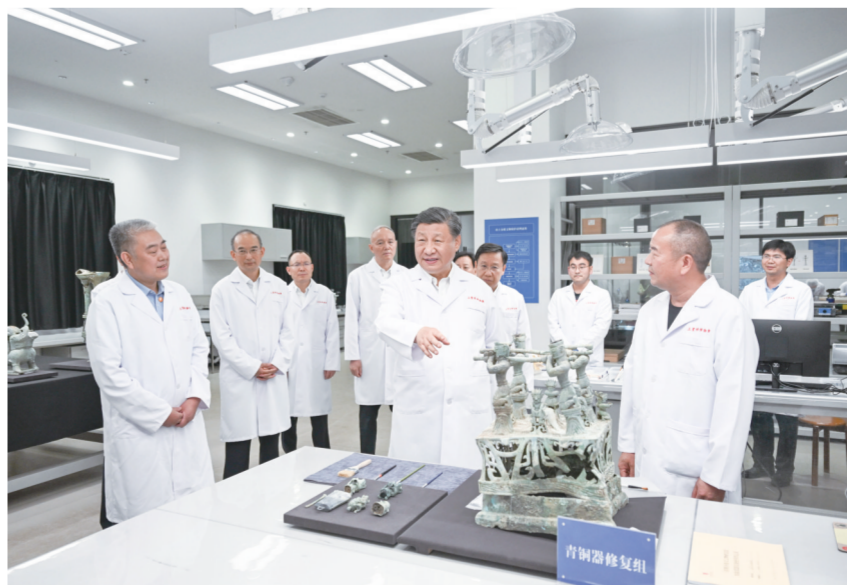
7月25日至27日，中共中央总书记、国家主席、中央军委主席习近平在四川考察。这是26日下午，习近平在位于德阳市广汉市的三星堆博物馆文物保护与修复馆，同现场工作人员亲切交流。

行察看千年古柏长势，详细询问历史上植柏护柏情况。他指出，这片全世界最大的人工古柏林，之所以能够延续得这