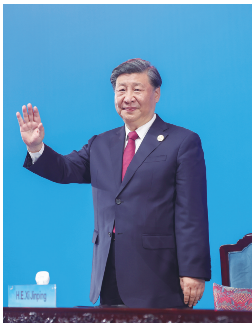
7月28日晚，第三十一届世界大学生夏季运动会在四川省成都市隆重开幕。这是国家主席习近平在主席台上向大家挥手致意。

新华社成都7月28日电 共享大运盛会，共谱青春华章。第三十一届世界大学生夏季运动会28日晚在四川省成都市隆重开幕。国家主席习近平出席开幕式并宣布本届大运会开幕。