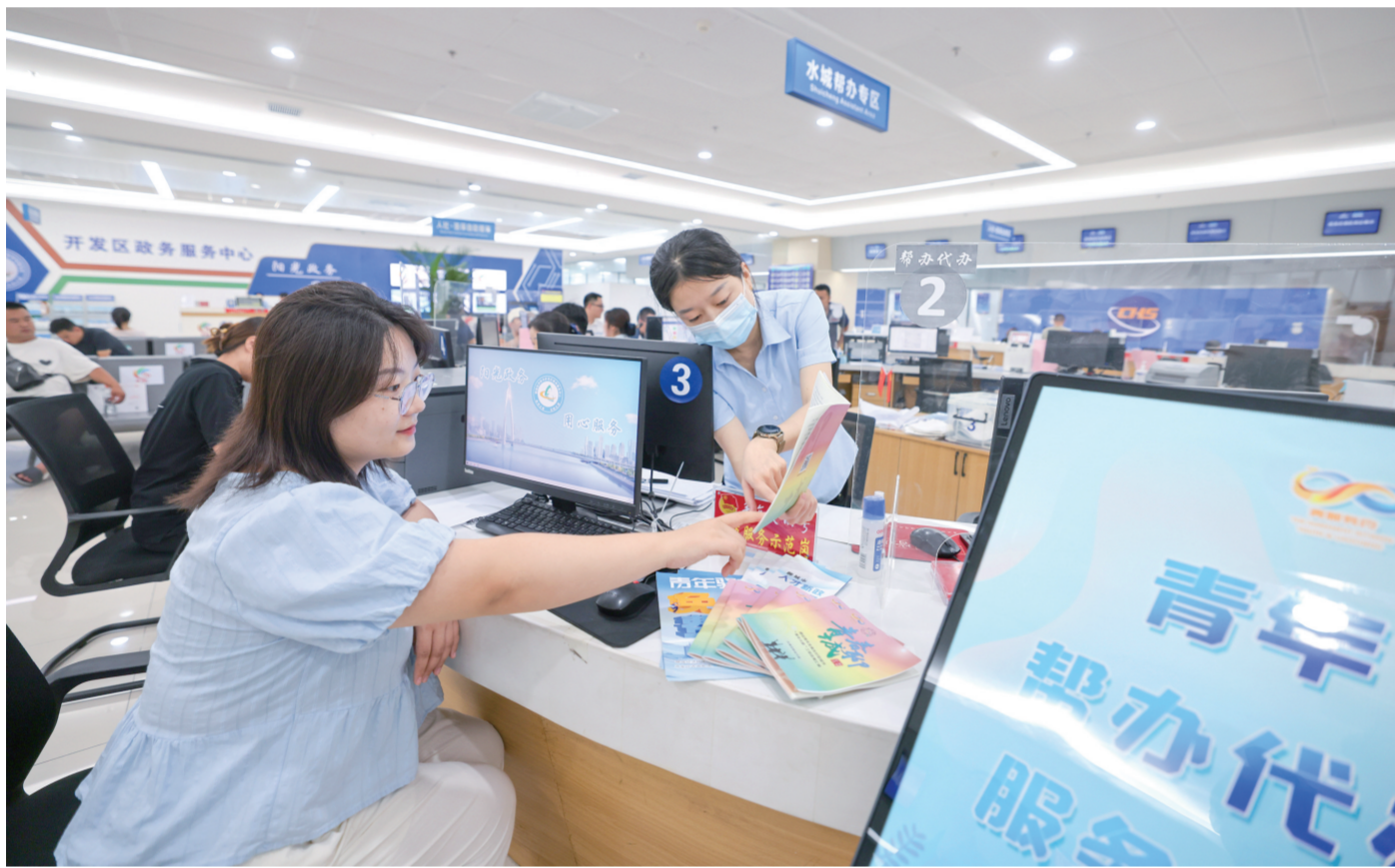
8月16日，在开发区政务服务中心青年帮办代办服务驿站，政务先锋青年志愿服务团队成员在为创业青年介绍在聊创业优惠政策。

聚焦乡村振兴人才需求，东昌府区积极培育壮大爱农业、懂技术、善经营的新型职业农民队伍。通过推行“互联网+技能培训”，培训农村劳动力，积极选培乡村好青年，真金白银扶持农业农村人才队伍，为乡村全面振兴注入人才活水。同时，强化农村青年直播电商人才培育，打造直播电商中心，已举办电商培训336期，培训农村电商各类人才23209人，连续4年组织新型职业农民职称评审，评出“土专家”“田秀才”41人。