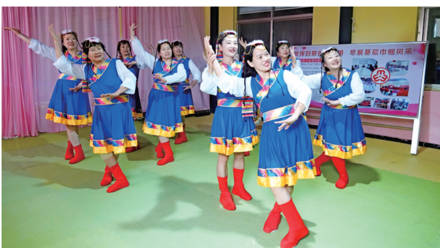
妇女群众在“妇女微家”学习民族舞