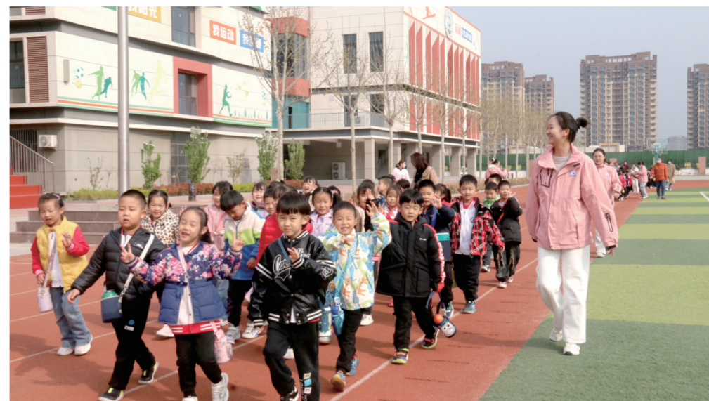
为了帮助孩子们了解小学生活,做好幼小衔接工作,4月3日,聊城市实验幼儿园组织大班幼儿走进高新区第二实验小学,开启小学探秘之旅。