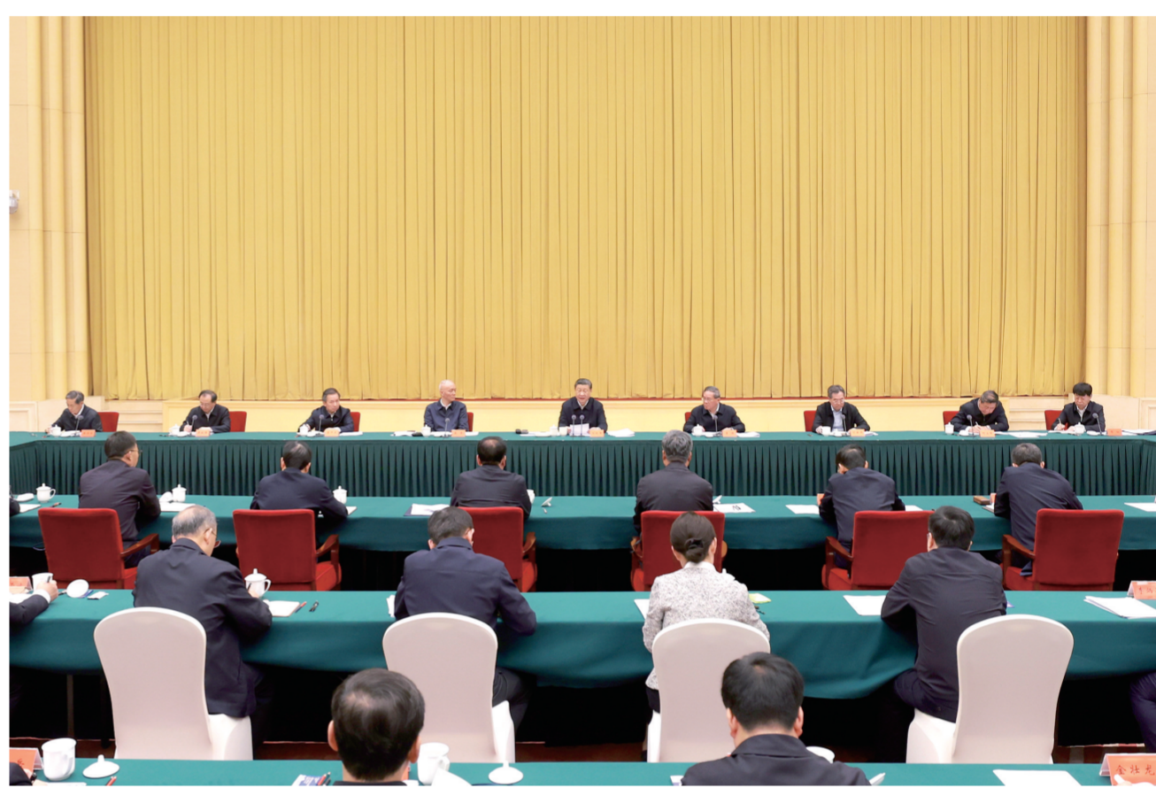
4月23日下午，中共中央总书记、国家主席、中央军委主席习近平在重庆主持召开新时代推动西部大开发座谈会并发表重要讲话。

新华社重庆4月23日电 中共中央总书记、国家主席、中央军委主席习近平23日下午在重庆主持召开新时代推动西部大开发座谈会并发表重要讲话。他强调，西部地区在全国改革发展稳定大局中举足轻重。要一以贯之抓好党中央推动西部大开发政策举措的贯彻落实，进一步形成大保护、大开放、高质量发展新格局，提升区域整体实力和可持续发展能力，在中国式现代化建设中奋力谱写西部大开发新篇章。