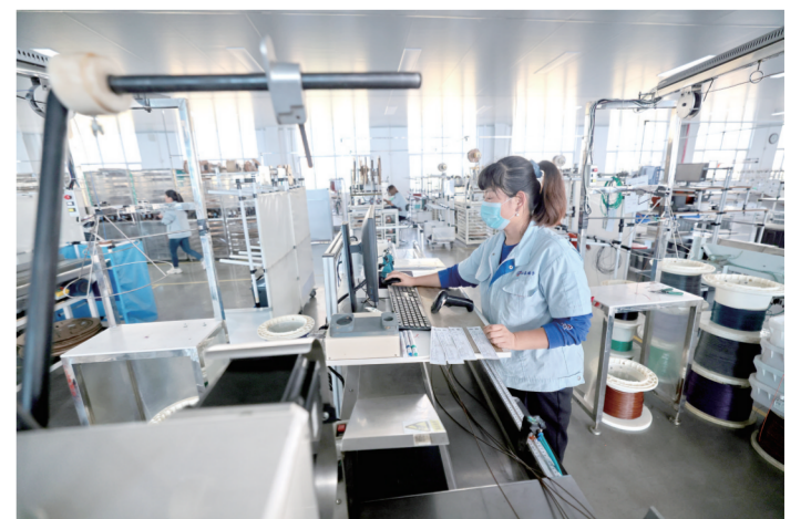
4月21日,工人在山东端子电器股份有限公司生产车间作业。作为省级专精特新企业,该公司围绕提质、增效、降耗,加大技术研发力度,打造数字化车间,车用整车线生产实现智能化。 ■ 本报记者 许金松

近年来,我市认真落实国家深化“放管服”改革、优化营商环境决策部署和省市相关具体工作要求,以“聊·诚办”品牌建设为抓手,在提高服务的同时,严格落实“四个最严”要求。在涉及食品安全的关键条件、关键要素等方面严格把关、从严掌握,严格把好食品生产经营许可源头关,筑牢食品安全防火墙。同时,畅通审管联动机制、创新提升服务,在审批标准、监管机制、勘验手段等方面进行了方法创新和有力落实,既保障了食品安全,也为食品经营者提供了便利、高效的政务服务。