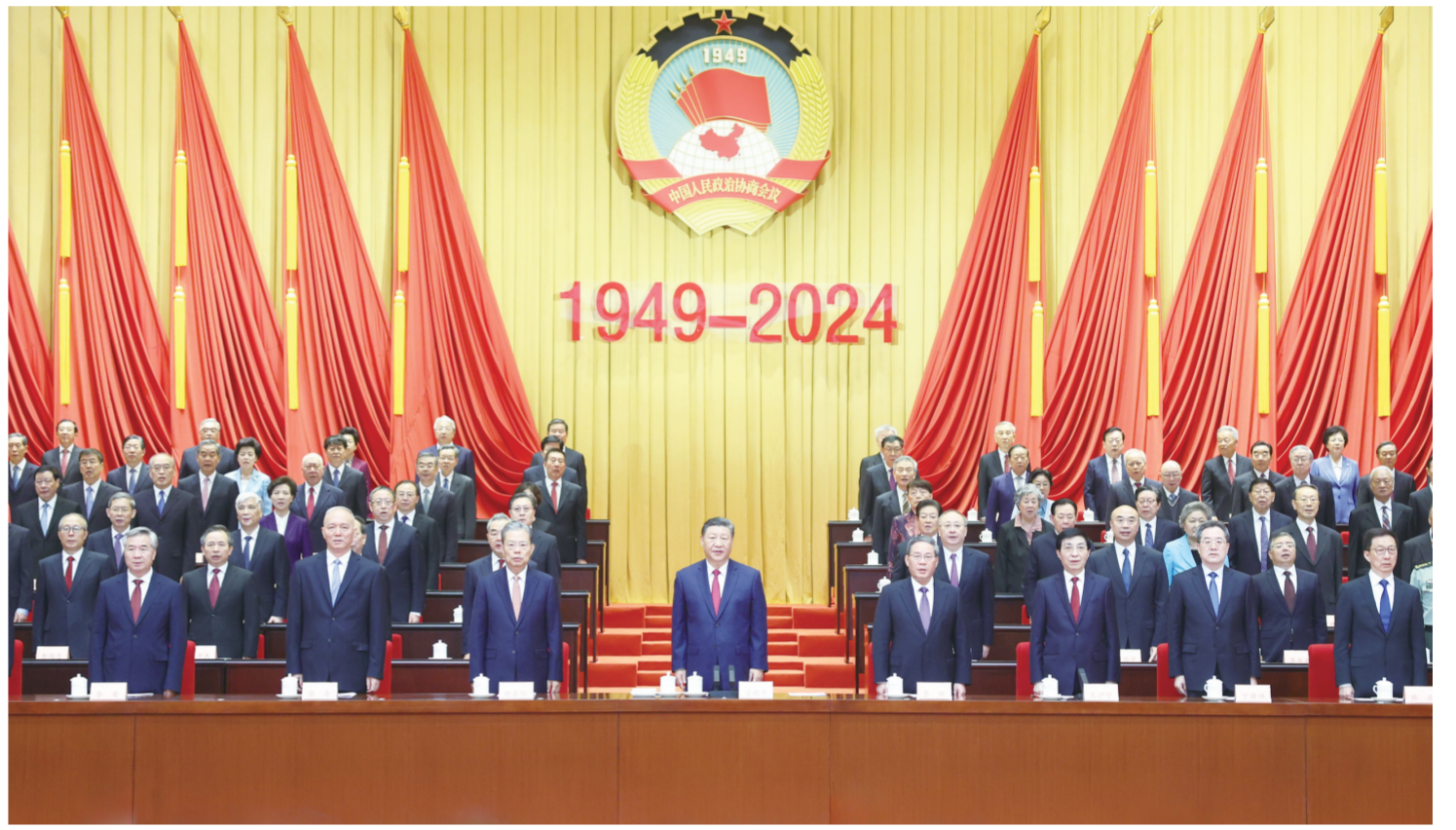
9月20日上午,中共中央、全国政协在全国政协礼堂隆重举行庆祝中国人民政治协商会议成立75周年大会。中共中央总书记、国家主席、中央军委主席习近平出席大会并发表重要讲话。