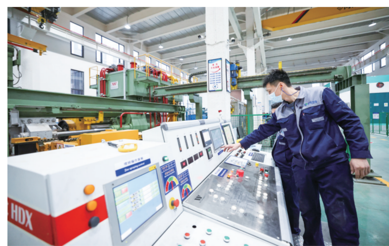
11月27日,在位于东昌府区的山东宏远金属年产3万吨高精铝合金微通道高管项目现场,工作人员正操作智慧控制面板。

未来,我市将继续坚持绿色发展理念,探索实现绿色化工产业低碳发展的新路径,推动全产业链节能降碳、向优发展,以产业“含绿量”提升发展“含金量”。