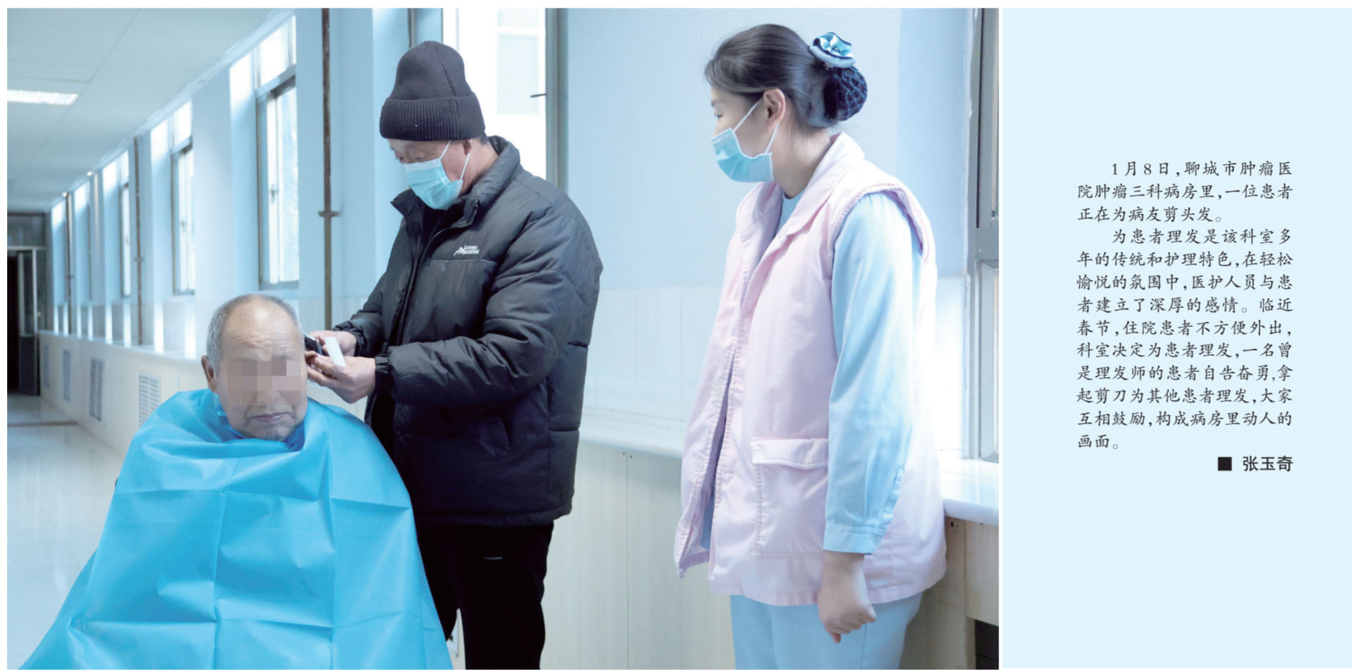
1月8日,聊城市肿瘤医院肿瘤三科病房里,一位患者正在为病友剪头发。为患者理发是该科室多年的传统和护理特色,在轻松愉悦的氛围中,医护人员与患者建立了深厚的感情。临近春节,住院患者不方便外出,科室决定为患者理发,一名曾是理发师的患者自告奋勇,拿起剪刀为其他患者理发,大家互相鼓励,构成病房里动人的画面。

如今,铜城街道社区卫生服务中心建立了一键报警系统、视频监控系统和与公安联网。最小应急单元”由医院保卫干部牵头,年轻工作人员为主力成员,为群众就医安全提供了保障。