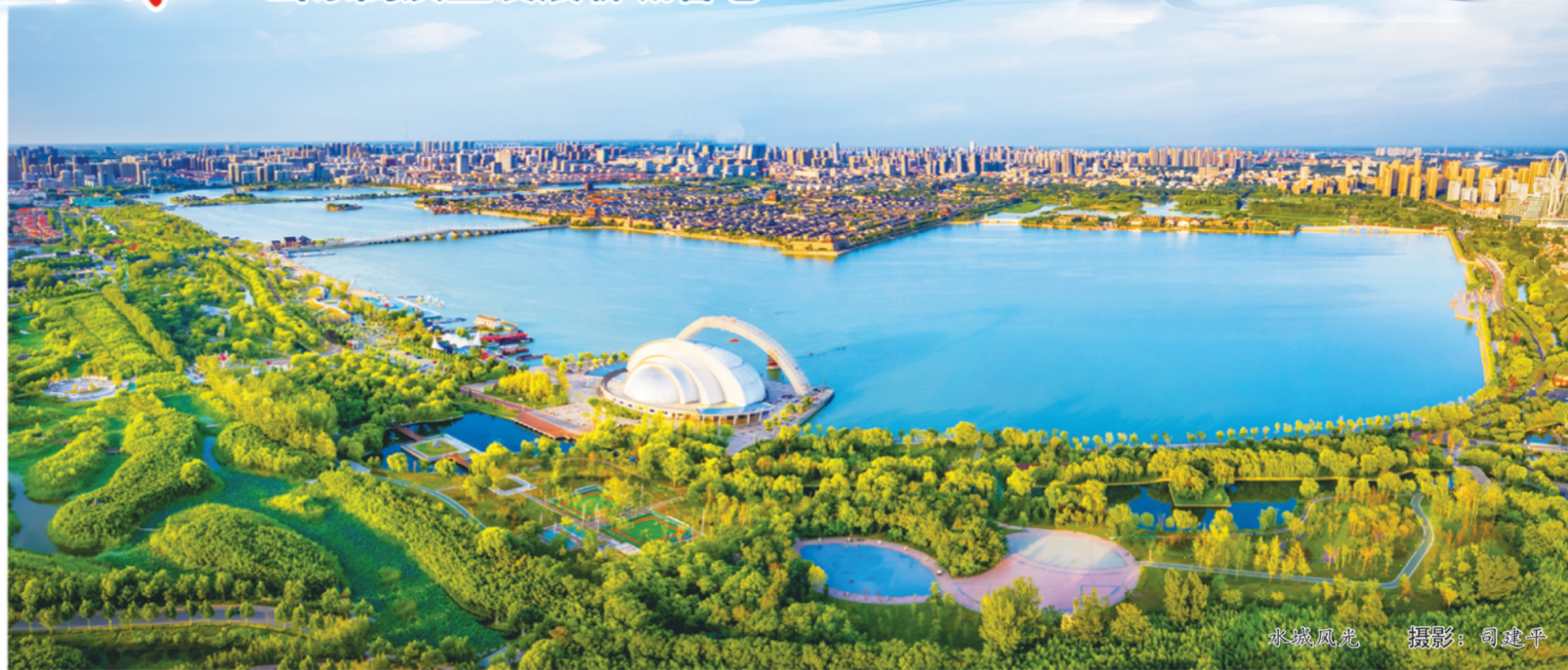
聊城风光