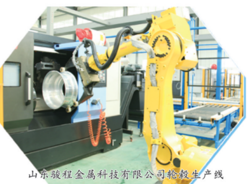
山东骏程金属科技有限公司轮毂生产线

传统产业加速转型,新兴产业蓄势崛起。10月28日,在阳谷县波米科技有限公司实验室里,工程师专注调试集成电路封装用光敏性聚酰亚