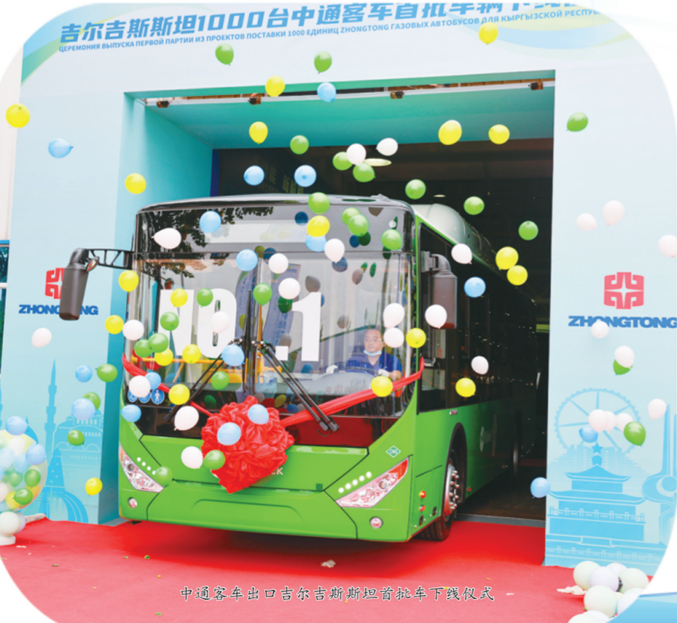
中通客车出口吉尔吉斯斯坦首批车下线仪式

动能澎湃,乘势而上。聊城,这座植根于齐鲁沃土、因水而兴的千年古城,正昂首跨入新征程,一幅奋楫争先的崛起画卷,正在鲁西大地展开!