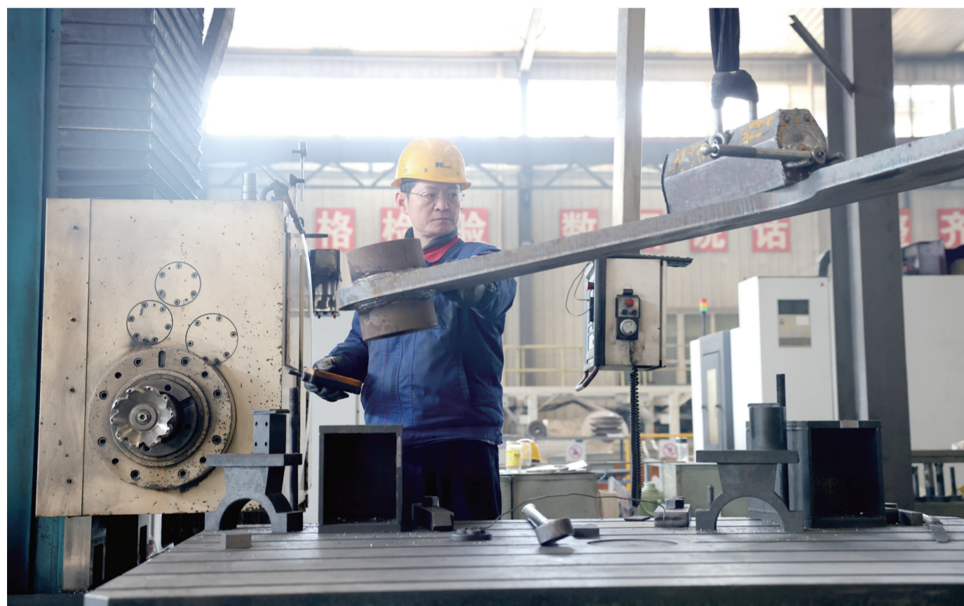
1月16日,位于高新区的山东信和造纸工程股份有限公司车间内,工人正在加工产品。该公司是一家集造纸机械研发制造和安装总包于一体的企业,聚焦产品的性能和质量,对卫生纸机真空托辊、钢制托辊烘缸等关键部件进行核心攻关,攻克了造纸领域节能、低碳、环保、高产、高质量等诸多方面的难题。

创新的巧思与政府托底的合力。当政策的阳光雨露精准滴灌到企业的根部,创新的种子便能破土而出,茁壮成长。这正是高质量发展的微观基础所在。