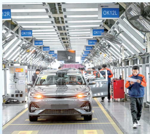
1月19日,工人在贵州省贵阳市观山湖一家汽车制造企业的车间内工作。