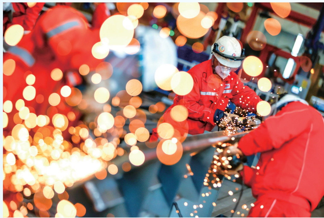
1月19日,在天津市滨海新区,海上油气平台建设工人进行打磨作业。