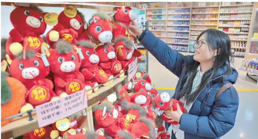
2月2日，市民在城区一超市选购生肖马玩偶。春节临近，我市年货市场持续升温，广大市民在购物消费中尽享浓浓年味。

近年来，我市将“信用交通县”创建作为深化“放管服”改革、优化营商环境、提升行业治理能力的抓手，加强顶层设计，全域统筹推进。在创建过程中，我市注重结合实际，突出特色，积极探索“信用+”应用场景，形成了“一县一特色”的生动局面。我市将持续深化信用评价结果在运输服务、工程建设、行政执法等多领域的综合应用，推动信用建设从“建体系”向“见实效”深度转变，努力营造更加诚实守信、规范有序交通运输市场环境。