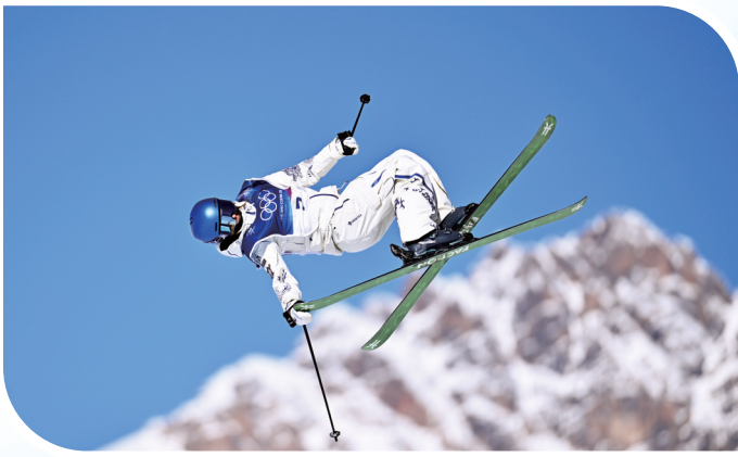
2月7日,谷爱凌在比赛中。当地时间2月7日,在意大利利维尼奥举行的米兰-科尔蒂纳冬奥会自由式滑雪女子坡面障碍技巧资格赛中,中国选手谷爱凌、刘梦婷、杨如意和韩林杉迎来本届赛事首秀。