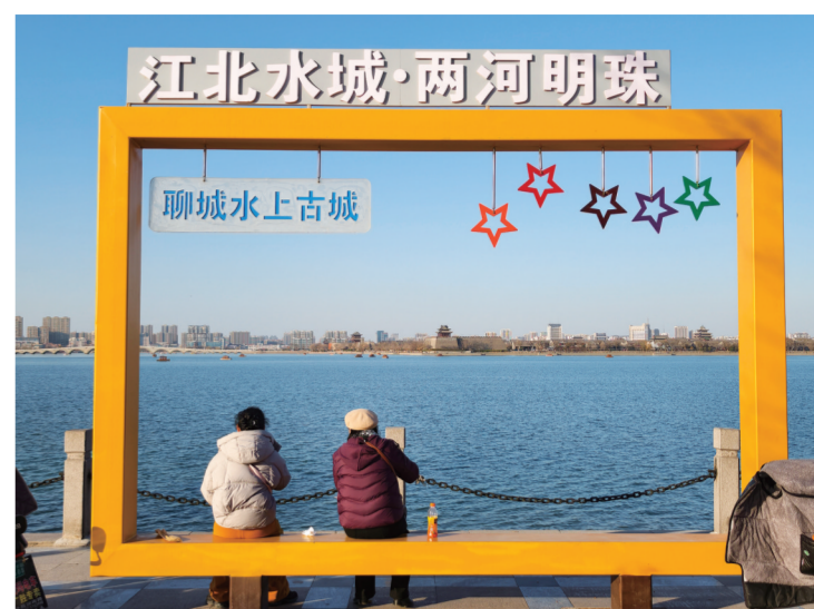
2月19日,市民在东昌湖畔游玩,享受惬意假期。