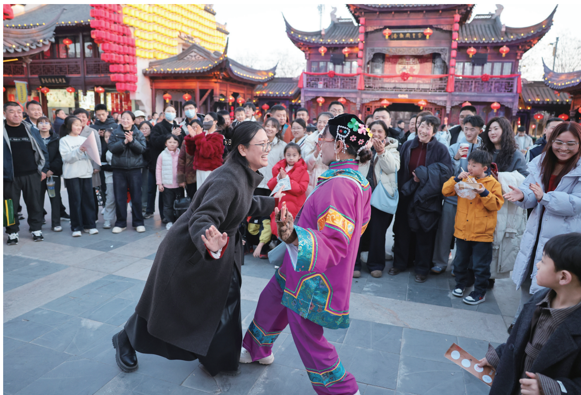
2月22日,临清东园景区婆婆斗舞诙谐逗趣,吸引了众多游客参与,现场笑声不断。