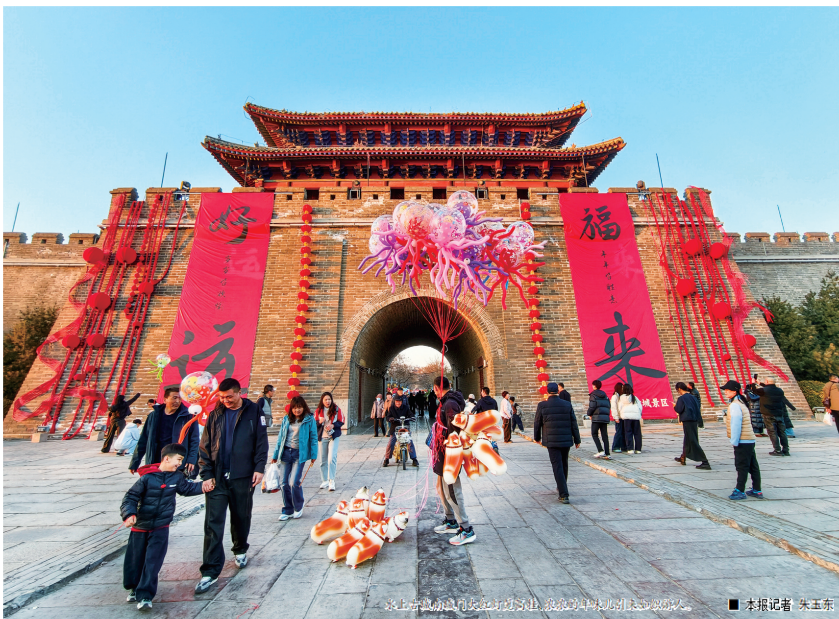
水上古城东大门红灯笼高挂,浓浓的年味扑面而来。