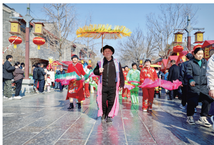
2月20日,聊城水上古城景区的民俗表演吸引了众多市民游客驻足观看。