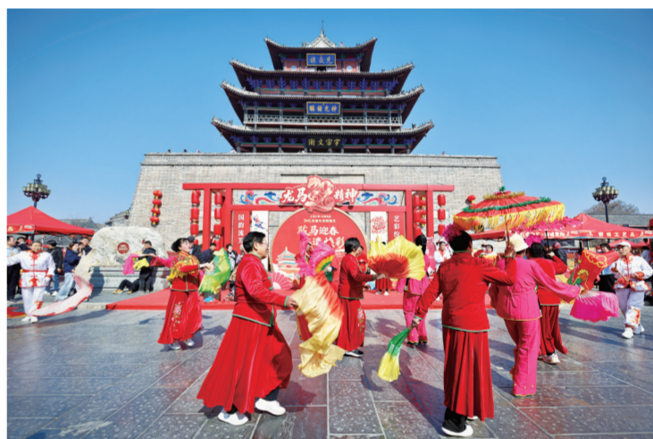
光岳楼下,各类民俗展演精彩纷呈。