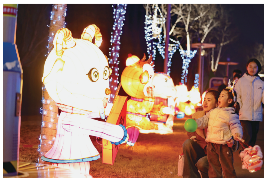
2月17日,市民在九州洼月季旅游景区新春灯会赏灯游玩。