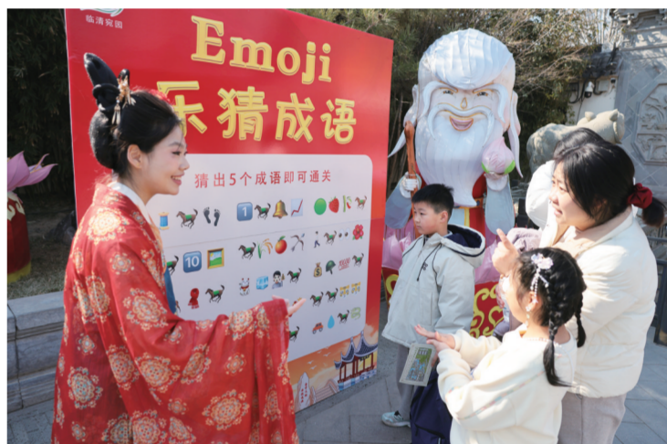
2月22日,临清东园景区,游客在猜谜闯关。

本期摄影版,我们以镜头为眼,聚焦一张张笑脸与幕幕精彩,带您重温那份红红火火的新春记忆,感受聊城文旅融合的勃勃生机。