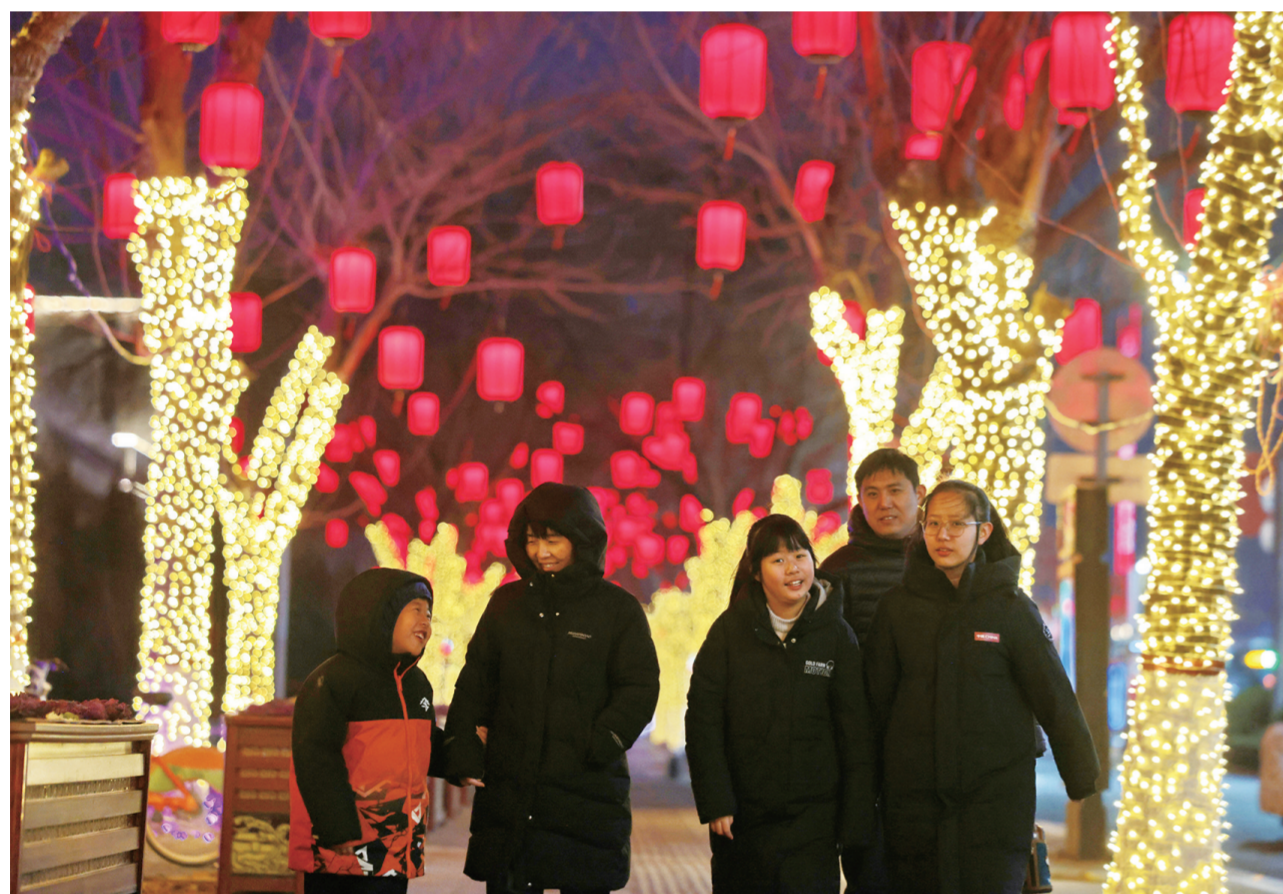
2月20日晚,市民在东昌路观灯赏景。水城街头张灯结彩,处处洋溢着喜庆的节日氛围。