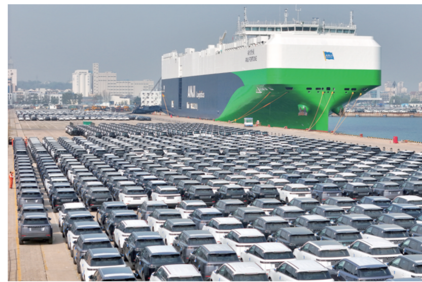
4月14日,国产汽车在山东港口烟台港等待装船出口(无人机照片)。

20.2%、4%。 动能强,主要体现在出口结构向新向优,进口动能明显走强。一季度,伴随外部需求回暖,我国产业配套体系优势进一步释放,我国出口6.85万亿元,同比增长11.9%,其中3D打印机、电动汽车、锂电池等绿色产品出口分别增长119%、77.5%和50.4%。我国进口4.99万亿元,增长19.6%,规模创历史新高。其中,进口机电产品、消费品同比分别增长21.7%和5.4%。