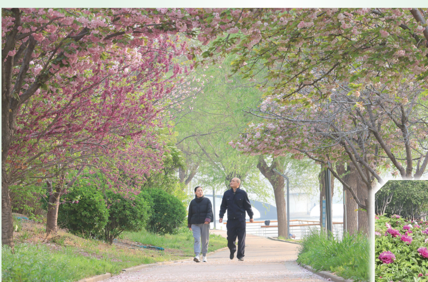
4月12日,九州洼月季旅游景区内牡丹花开放,吸引大批游客驻足观看、拍照留念。

东昌府区依托文化书院搭建的非遗传承平台,吸纳非遗代表性传承人、专业教师组成服务队,推动优质文化资源直达基层。自文化书院成立以来,累计开展非遗进校园、进社区活动80余场次,服务群众3000余人次,培育本土文化人才56名。