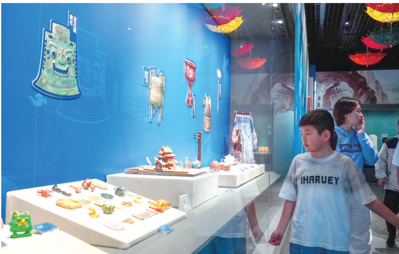
4月29日,观众在参观山东博物馆的文创作品。

“五一”假期,我国南北天气差异明显,北方大部晴暖少雨,气候舒适度大多在“舒适”等级,旅游出行适宜度等级高,仅西北部分地区偶有沙尘。袁佳双说,综合天气情况,假期优先推荐前往北方地区出游,北京、河北、山东半岛、东北大部适合踏青、赏花,去滨海及山地游玩。西北地区除东部局部雨雪外,青海、新疆等地天气平稳,适宜短途出游。