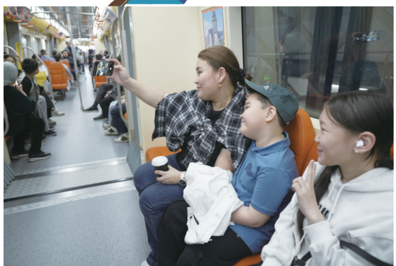
5月16日,在哈萨克斯坦阿斯塔纳,人们在轻轨上拍照。

由中国企业承建的哈萨克斯坦首都阿斯塔纳轻轨项目一期工程5月16日举行通车仪式。哈总统托卡耶夫当天作为轻轨首名乘客,从机场站搭乘至国家博物馆站。