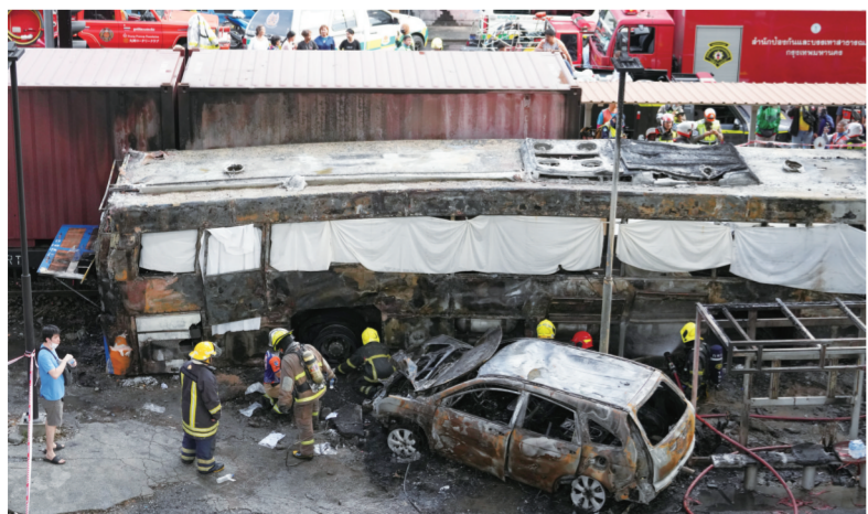
5月16日,救援人员在泰国曼谷市区的事故现场工作。

由中国企业承建的哈萨克斯坦首都阿斯塔纳轻轨项目一期工程5月16日举行通车仪式。哈总统托卡耶夫当天作为轻轨首名乘客,从机场站搭乘至国家博物馆站。