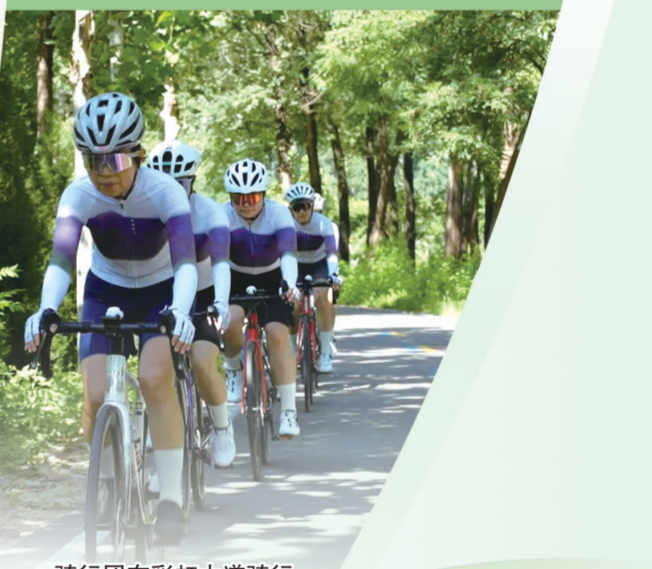
骑行团在彩虹大道骑行