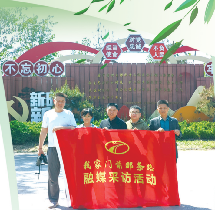
“我家门前那条路”融媒采访团