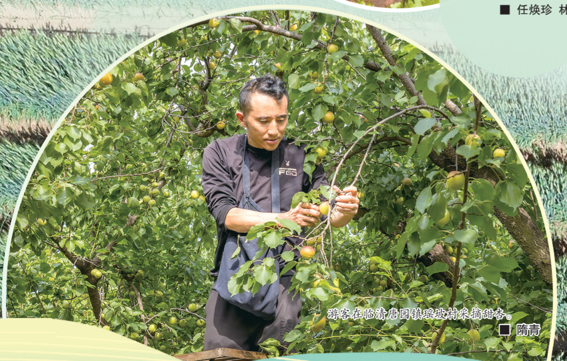
游客在临清唐园镇瑶坡村采摘甜杏。

从“杏”找人到人找“杏”,从单一卖果到三产融合,瑶坡村三百年的老杏树结出了乡村振兴的“致富果”。