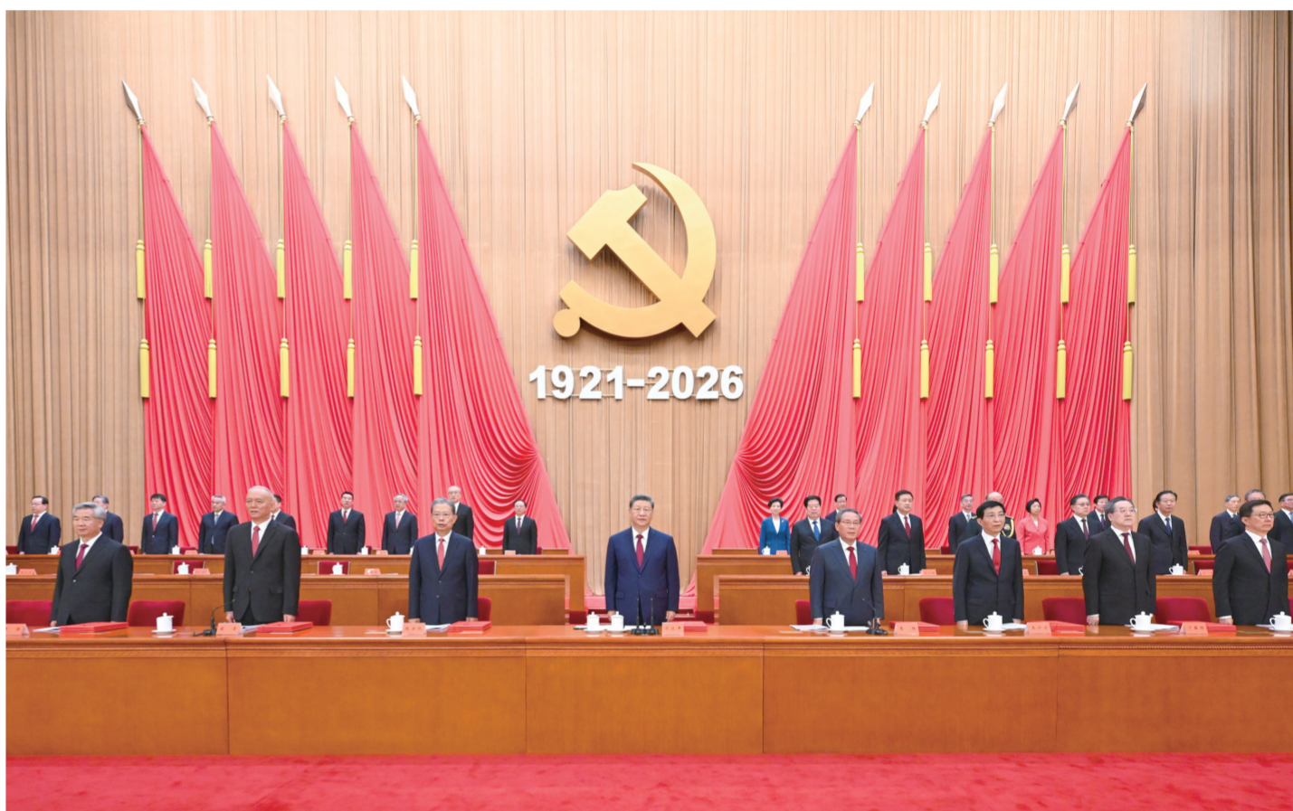
7月1日上午，庆祝中国共产党成立105周年大会在北京人民大会堂隆重举行。习近平、李强、赵乐际、王沪宁、蔡奇、丁薛祥、李希、韩正等出席大会。

新华社北京7月1日电 庆祝中国共产党成立105周年大会7月1日上午在北京人民大会堂隆重举行。中共中央总书记、国家主席、中央军委主席习近平向“七一勋章”获得者颁授勋章并发表重要讲话。他强调，105年来，我们党始终坚守为中国人民谋幸福、为中华民族谋复兴的初心使命，在不懈奋斗中创造了彪炳史册的伟大成就。新征程上，全党同志要坚定信心、接续奋斗，不断创造无愧于时代和人民的新业绩。